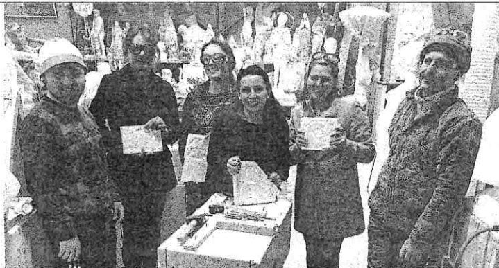
La visita al laboratorio dove le blogger hanno seguito una lezione di scultura

Il programma predisposto dalla Imm prevedeva la visita guidata in fuoristrada alle cave sia a cielo aperto che in galleria, la degustazione di prodotti tipici, la visita ad un laboratorio di scultura con tanto di lezione estemporanea, la degustazione del lardo a Colonnata e dei prodotti tipici presso un podere di Massa, un aperitivo e una cena sul mare a Marina di Carrara, la visita guidata al centro storico attraverso la Carrara medievale, Rinascimentale e Ottocentesca, la scoperta di Via Santa Maria, e dell'Accademia di Belle Arti di Carrara.