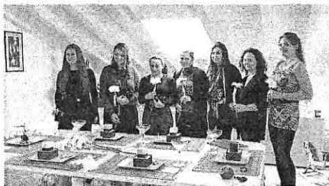
La degustazione dei prodotti tipici

Successo per l'iniziativa della Imm sul nostro territorio