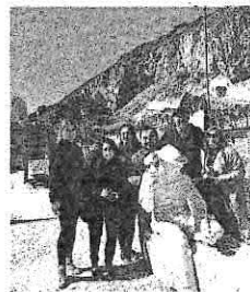
Alle cave di marmo

Buonarroti è tornato", che si è detta «affascinata dal centro storico dove basta alzare lo sguardo per vedere le targhe di marmo che ricordano i grandi artisti che in quelle case hanno dimorato. Un'esperienza bel-