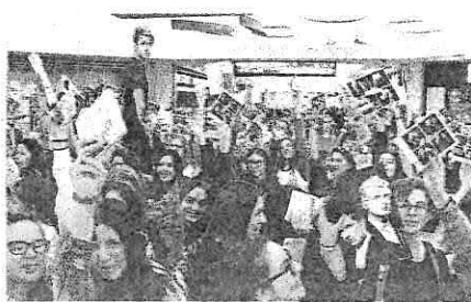
Un'immagine della fila delle ragazzine