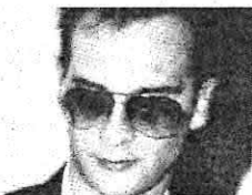
Il boss e l'albergo di Casciana

Matteo Messina Denaro frequenta la Toscana dove è protetto dalla 'ndrangheta. Lo dice un testimone. La provincia di Pisa al centro dei suoi interessi.