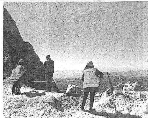
Il panorama dalle cave