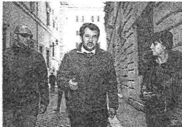
Matteo Salvini a passeggio per Roma